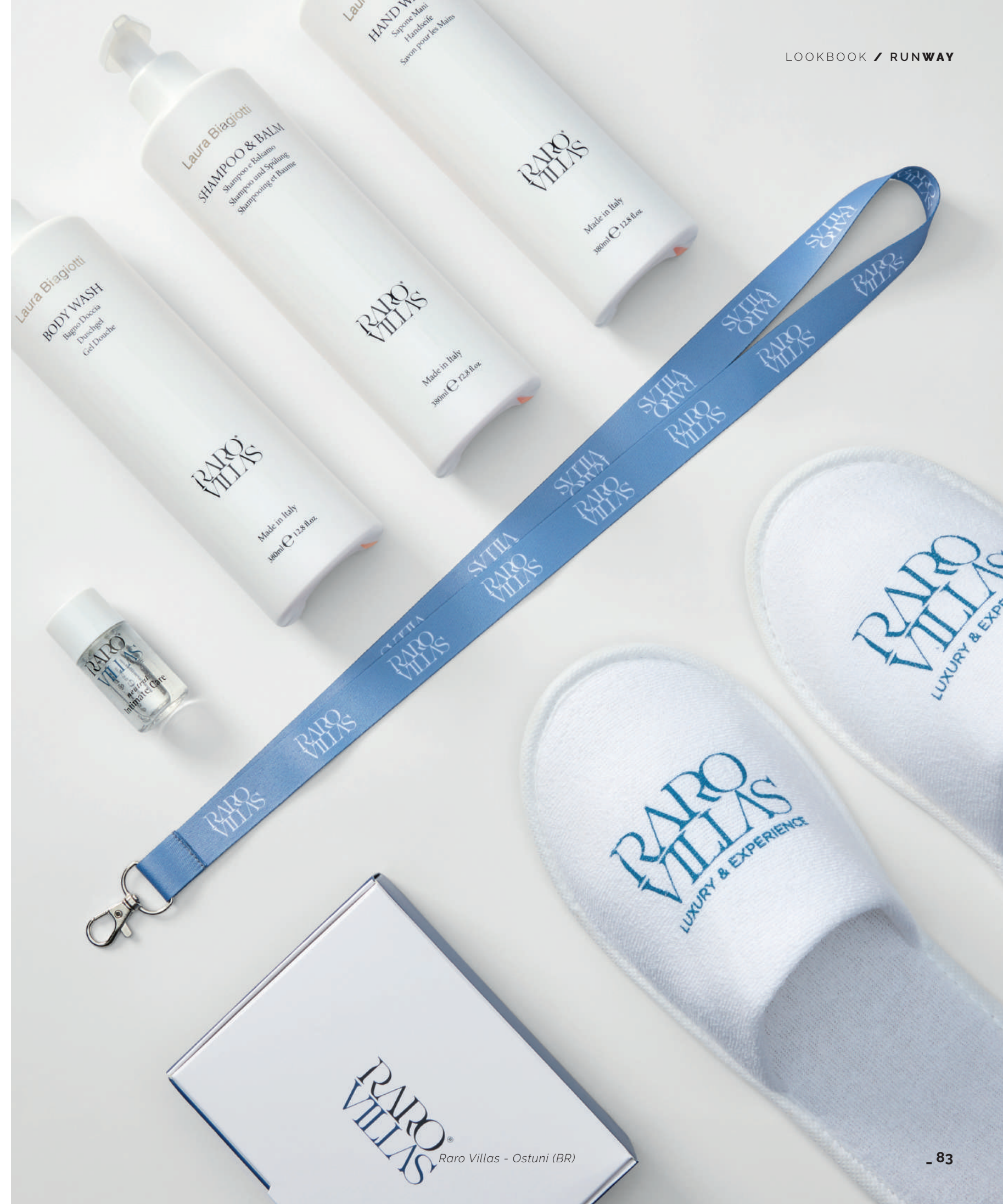
RARO VILLAS Raro Villas - Ostuni (BR)