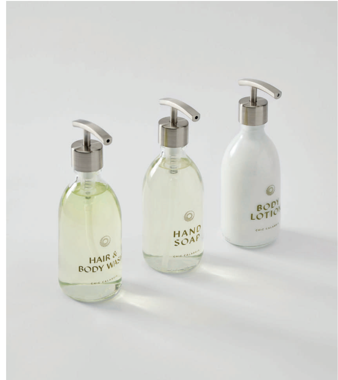
Baia del Sole - Ricadi (VV)