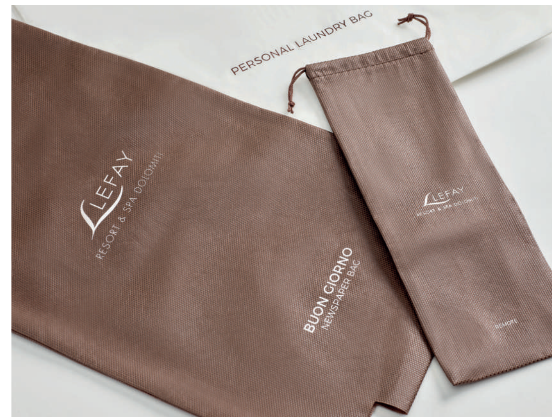
Lefay Resort & SPA - Gargnano (BS) / Pinzolo (TN)