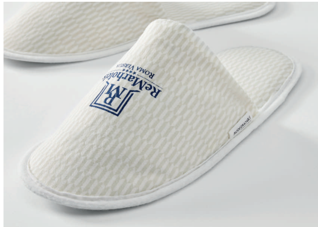
ReMarhotels - Roma (RM)