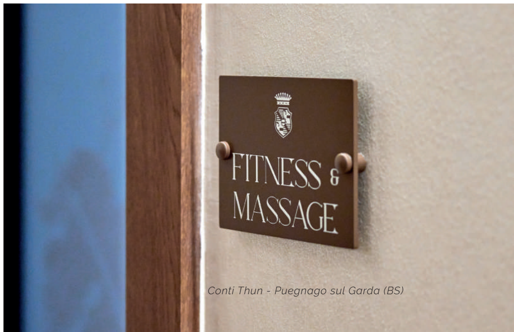
Conti Thun - Puegnago sul Garda (BS)