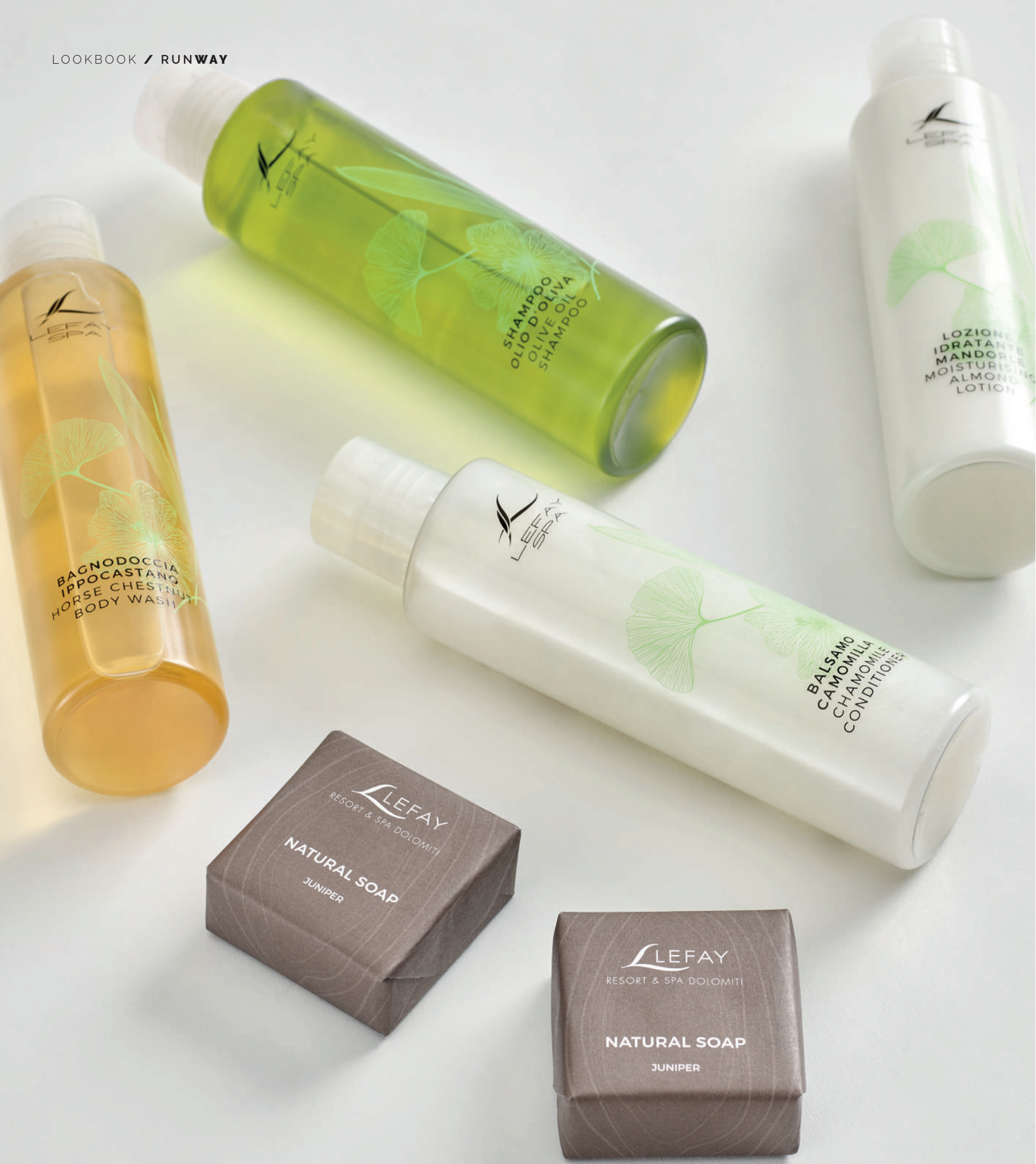
Lefay Resort & SPA - Gargnano (BS) / Pinzolo (TN)