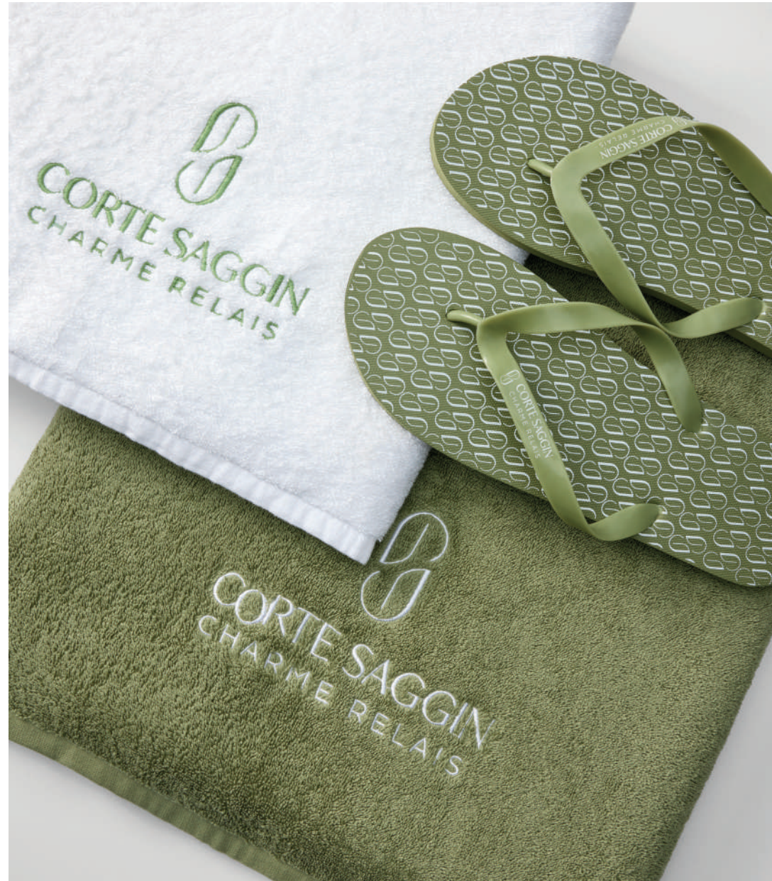
Corte Saggin - San Pietro in Cariano (VR)